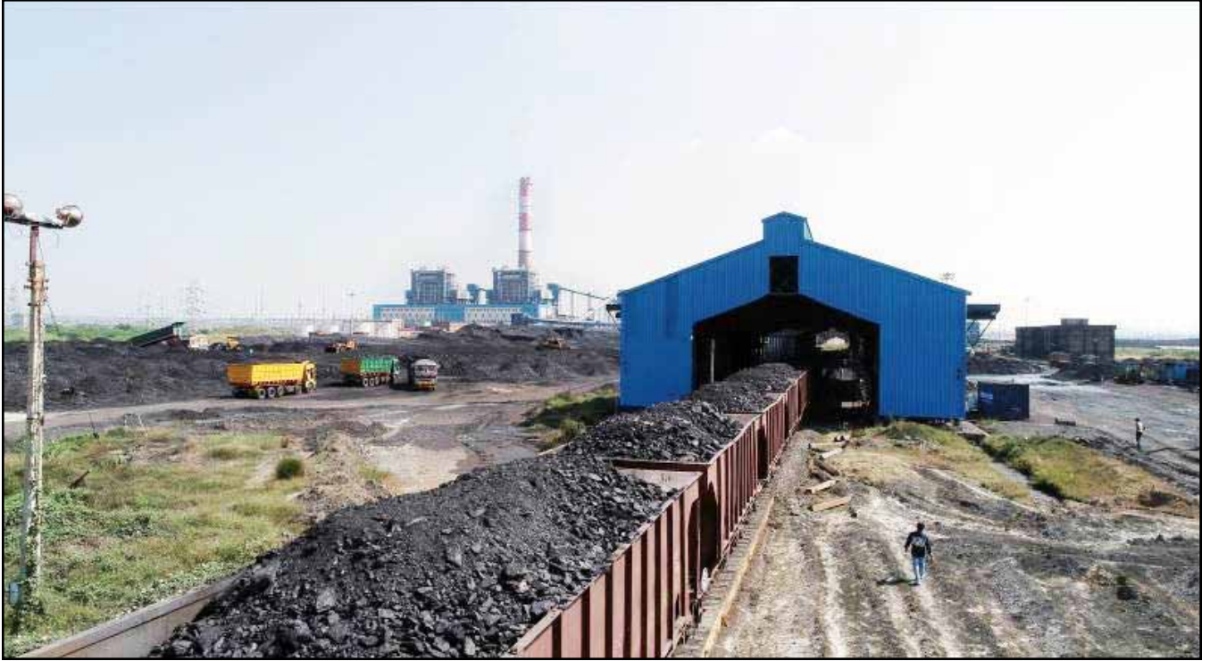
विद्युत संयंत्रों को अबाधित कोयला आपूर्ति